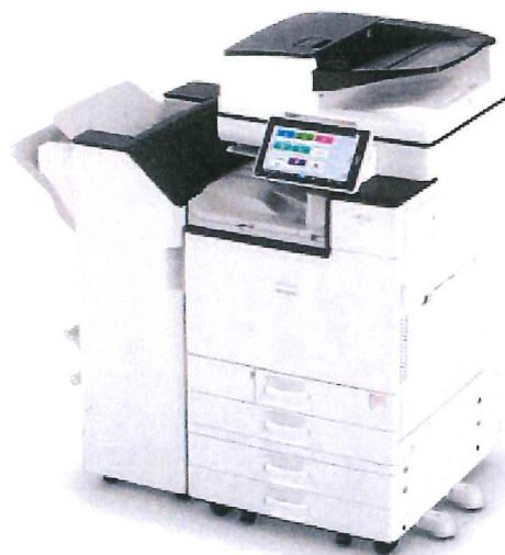
☆D X化スキャナー機は、 本所にあります。

お問合せ・お申込み ふかや市商工会(本所) 電話 048-584-2325 (北部支所) 電話 048-585-3750